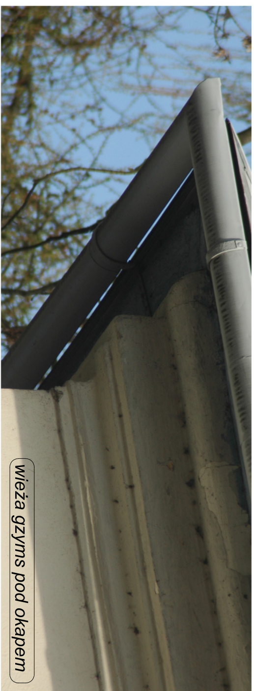
wieża gzyms pod okapem